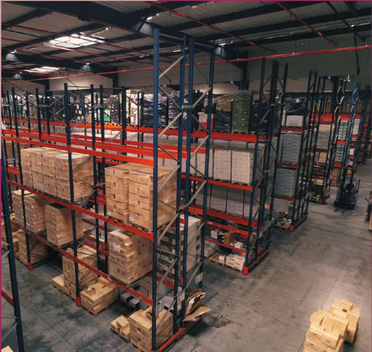
Le chai de 20 000m 2